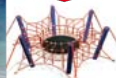
Jumping Spider - hoog 1,2 meter DX-1101