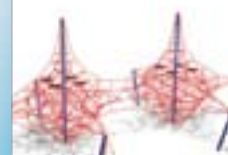
DX Galaxy - hoog 3,5 meter DX-204-1