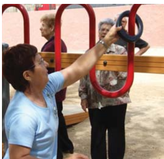
1) Zig-zag buis